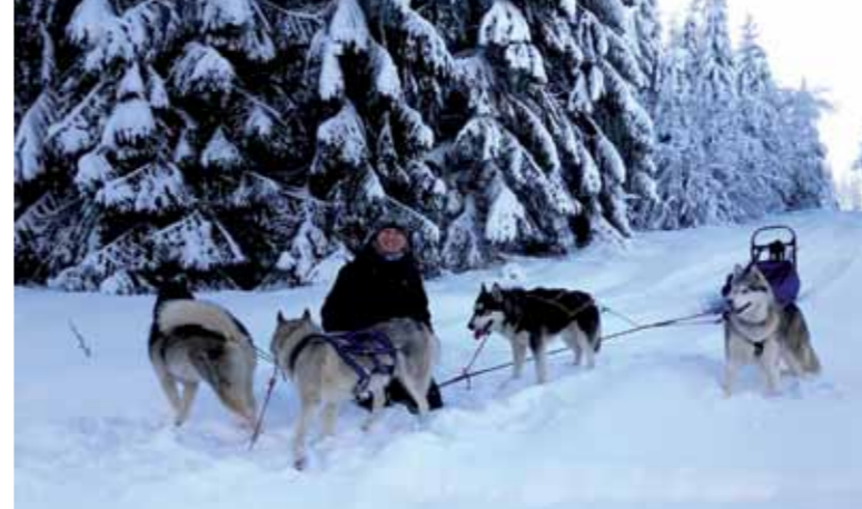
Spaß im Schnee am Idarkopf im Hunsrück

Yvonne: Ebenfalls Ende 2019 hatte ich meine Hundepension eröffnet.