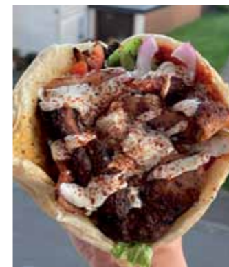
Der Bratwurstdöner à la Ibims

Unterstützung unsere Grillsaucen. Vor zwei Jahren schufen wir unsere erste BBQ-Sauce, die Spicy Smoke Sensation . Wem die zu mild ist, der kann die Spicy Smoke Explosion versuchen und für die völlig Schmerzfreien gibt es den Dauer(b)renner , eine Chilisauce, die man nur in homöopathi-